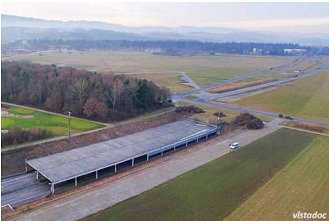
Die Splitterschutzgalerie vor dem Südportal des Allmendtunnels wird im Februar 2017 abgebrochen

Zwischen dem 13. und dem 28. Februar 2017 wird in zehn Nachtschichten die 110 Meter lange Splitterschutzgalerie vor dem Südportal des Allmendtunnels (s. Bild unten) zurückgebaut. Die Demontage der 88 Fertigelemente erfolgt mit Hilfe eines Pneukrans. Dazu muss jeweils eine Tunnelröhre gesperrt werden. Der Autobahnverkehr wird unter der Woche zwischen 20.00 Uhr und 05.00 Uhr einspurig und im Gegenverkehr durch den Allmendtunnel geführt. Je nach Witterung kann es zu Terminverschiebungen der Demontearbeiten kommen.